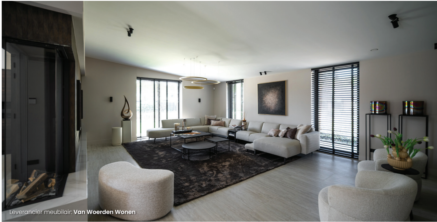
Leverancier meubilair: Van Woerden Wonen