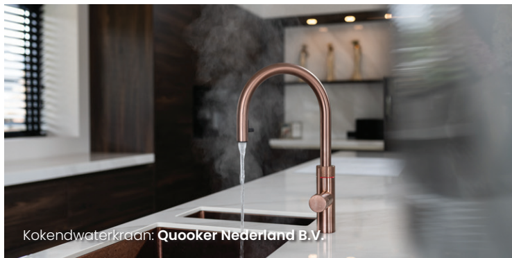
Kokendwaterkraan: Quooker Nederland B.V.