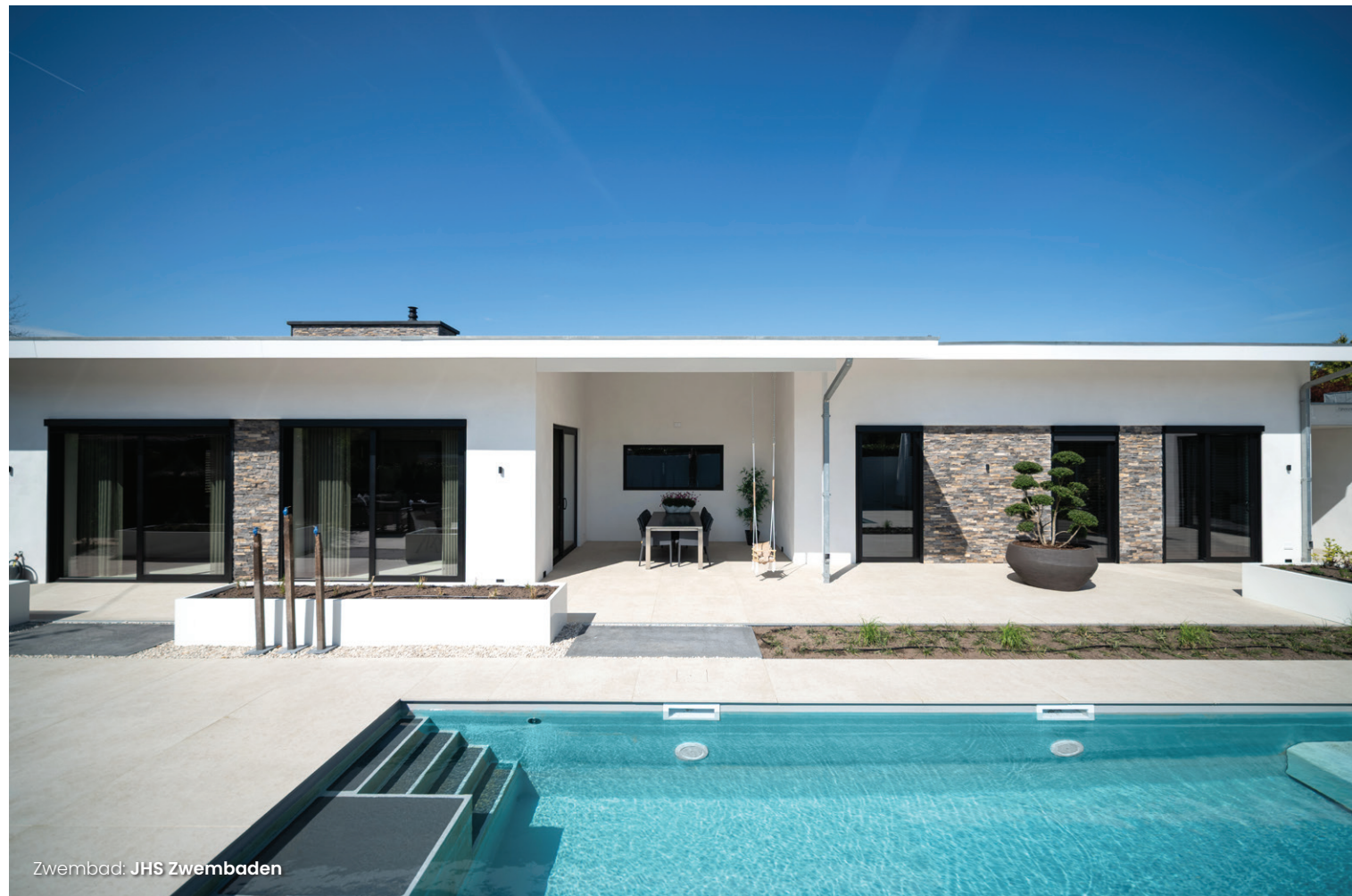
Zwembad: JHS Zwembaden