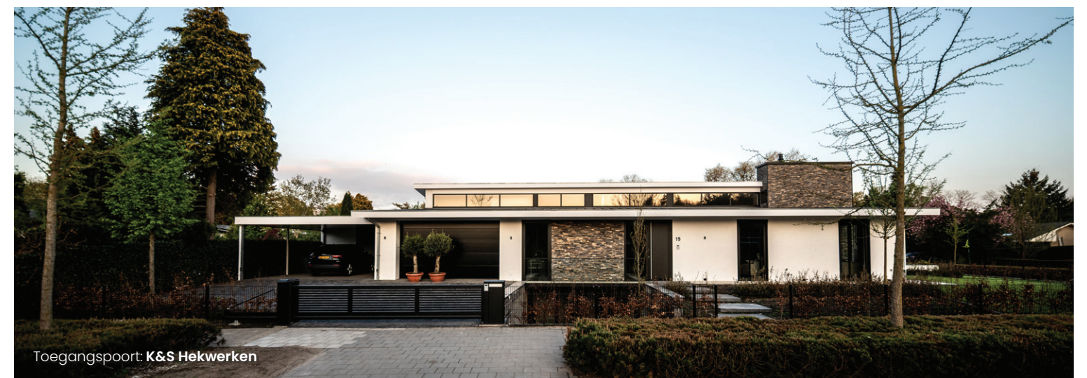
Toegangspoort: K&S Hekwerken