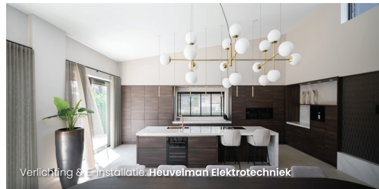
Verlichting & Installatie: Heuvelman Elektrotechniek