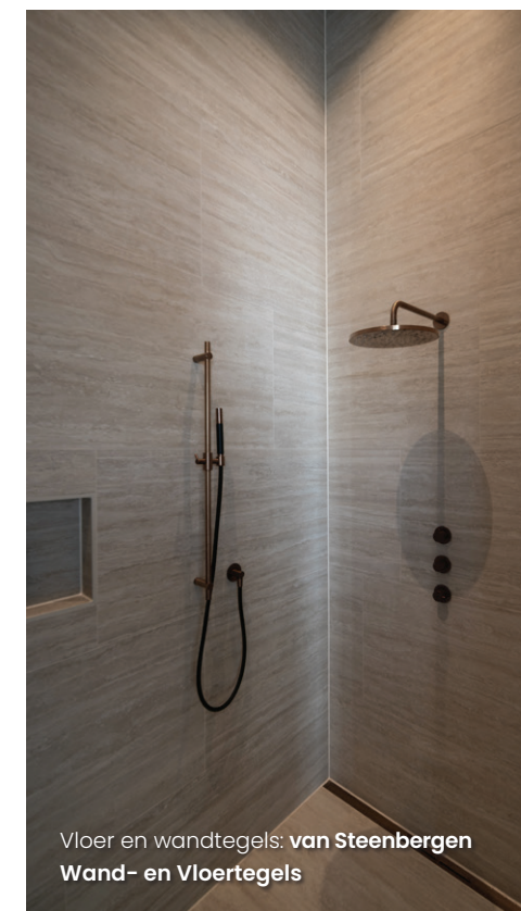
Vloer en wandtegels: van Steenberghe Wand- en Vloertegels