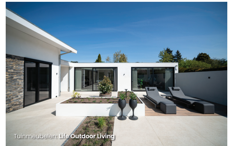
Tuinmeubelen: Life Outdoor Living