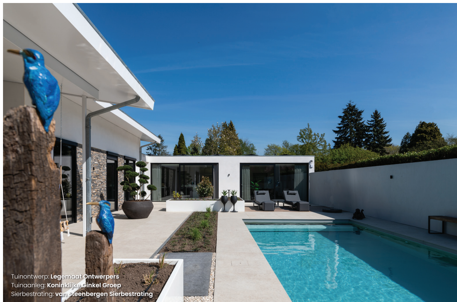
Tuinontwerp: Legemaat Ontwerpers Tuinaanleg: Koninklijke Ginkel Groep Sierbestrating: van Steenbergen Sierbestrating