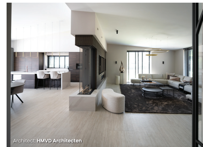
Architect: HMVD Architecten

De mainsuite is een royale ruimte met een slaapgedeelte, en-suitebadkamer en inloopkast. Grenzend aan de achtertuin vertegenwoordigt de mainsuite bij uitstek de vrije beleving in huis en de verbinding met buiten. De mainsuite heeft met een vrijstaand bad achter een stijlvolle roomdivider, de sfeer van een hotelsuite. Het zwevende badmeubel is net als de keuken voorzien van de elegante looks van notenhout. De rustige basis in de doucheruimte wordt gevormd door de travertinlook vloer- én wandtegels. Over de inloopkast vertelt Hoeshmand: “Ontwerpen doe ik voornamelijk op