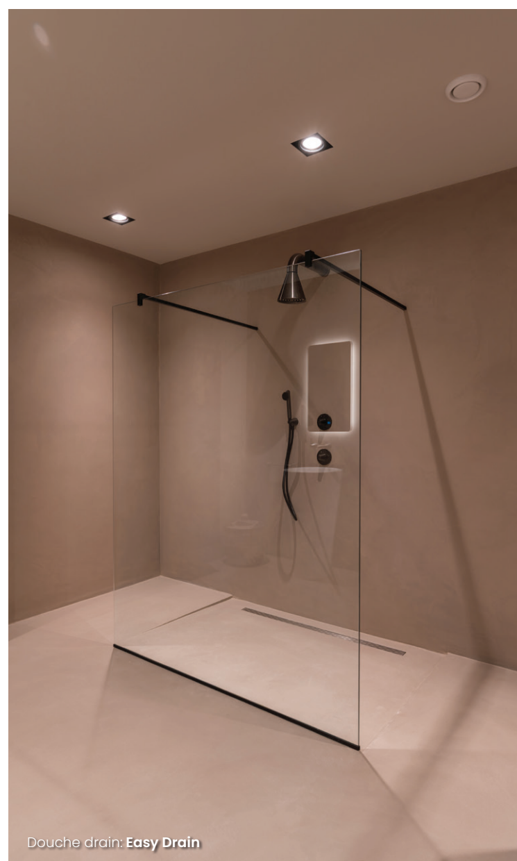
Douche drain: Easy Drain