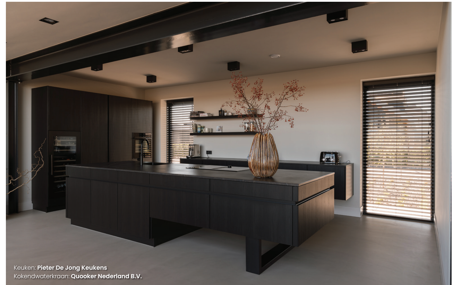
Keuken: Pieter De Jong Keukens Kokendwaterkraan: Quooker Nederland B.V.