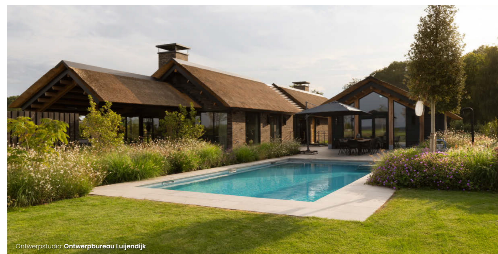
Ontwerpstudio: Ontwerpbureau Lujendijk