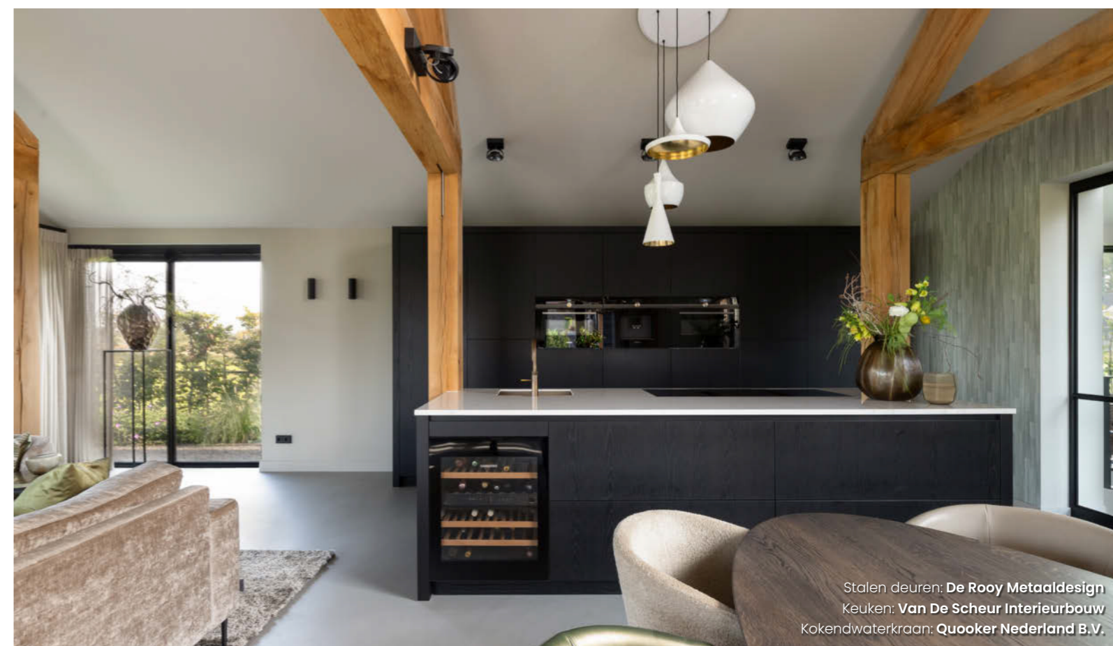
Stalen deuren: De Rooy Metaaldesign Keuken: Van De Scheur Interieurbouw Kokendwaterkraan: Quooker Nederland B.V.

Het woongedeelte is bewust bescheiden van omvang gehouden. Bewoonster: "We wilden geen grote woonkamer met veel ruimte waar je niets mee doet. Het moest allemaal functioneel zijn, want het gaat er hier vooral om dat je gezellig bij de open haard kunt zitten en van het uitzicht kunt genieten." Aangezien het een typische schuurwoning betreft, heeft het huis geen zolder. Om toch voldoende ruimte te creëren voor een kinderdomein, is er een kelder gemaakt rond een speciaal aangelegde ondergrondse patio. Deze zorgt voor daglichttoetreding in de drie op deze kelderverdieping gelegen slaapkamers.