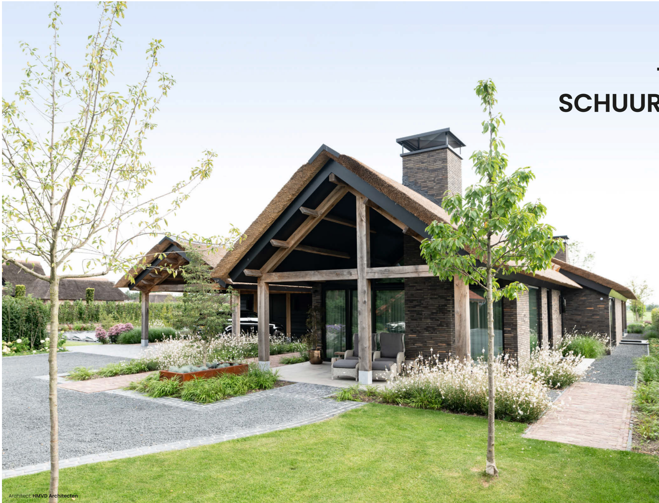
Architect: HMVD Architecten