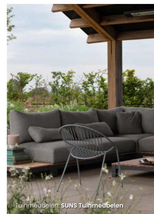
Tuinmeubelen: SUNS Tuinmeubelen