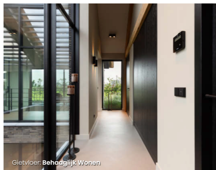
Gietvloer: Behaaglijk Wonen